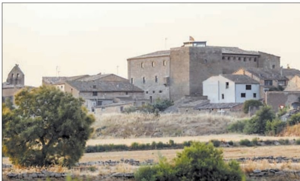
Imatge exterior del castell de Concabella, datat de 1040, on es poden visitar tres centres d'interpretació i exposicions