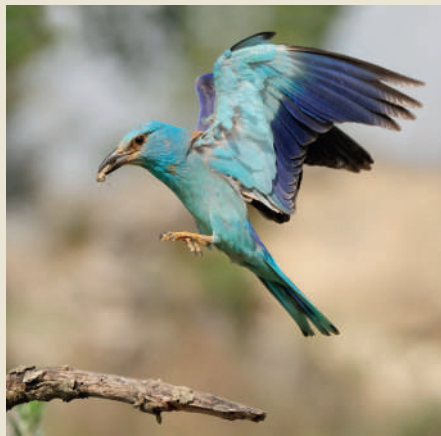
Gai blau.

La tradició secular del treball de la terra té com a protagonistes els cultius herbacis, sobretot l'ordi i el blat, alternats per erms i guarets, així com les fileres i camps d'ametllers i oliveres, i les tradicionals pastures extensives d'ovelles, cada cop menors. En són testimoni i patrimoni les nombroses manifestacions que es conserven