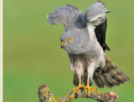
Esparver cendrós.