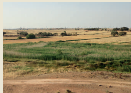
Aiguamolls de la Serra de Queralt